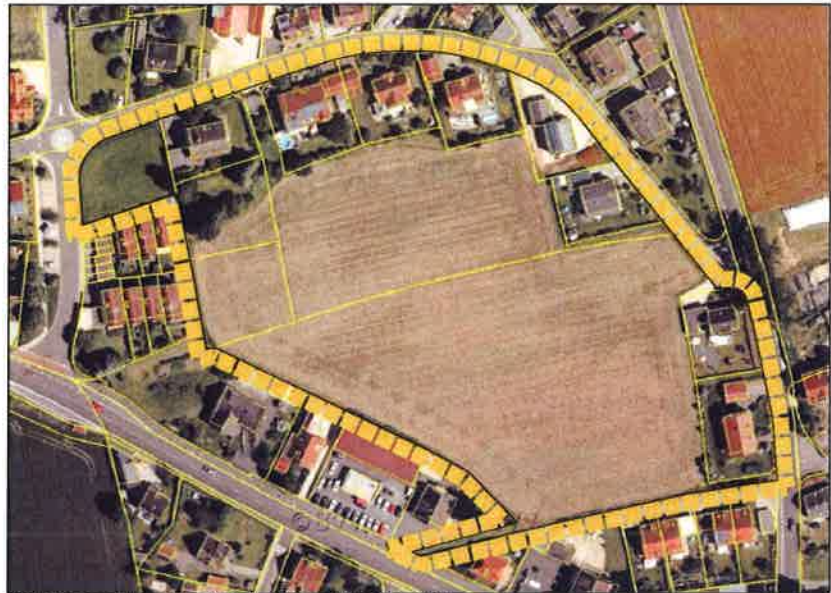
Luftbild und Fotoabgrenzung - unmaßstäblich, gerundet